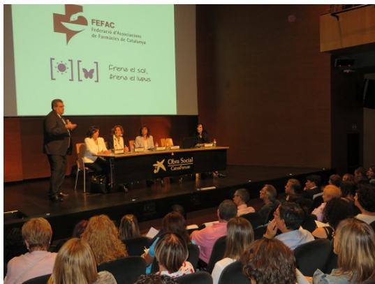
Caixaforum, Lérida, 22 de septiembre.