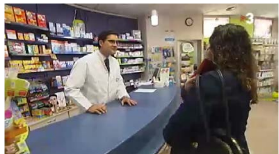
Una farmacia participante en la campaña, en TV3.