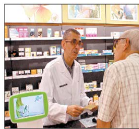
La farmacia Isanta es una de las colaboradoras