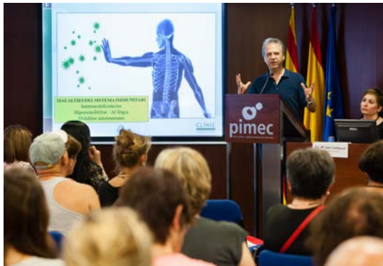
Auditorio PIMEC, Barcelona, 29 de junio.

Todas las intervenciones fueron grabadas en vídeo y pueden visionarse a través de los enlaces publicados en la web y Facebook.