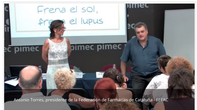
Sede de PIMEC, en Tarragona, 16 de julio.