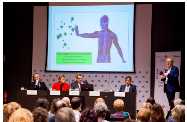
Caixaforum, Girona, 4 de noviembre.