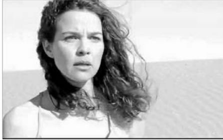
El corto 'El día cero', que se presenta este año en distintos festivales, aborda el caso de una afectada.

Explica que la enfermedad se manifiesta en brotes y lo que se intenta es que se mantenga la mayor cantidad de tiempo posible latente. Está demostrado que el sol es uno de los desencadenantes, es decir, es uno de los ele-